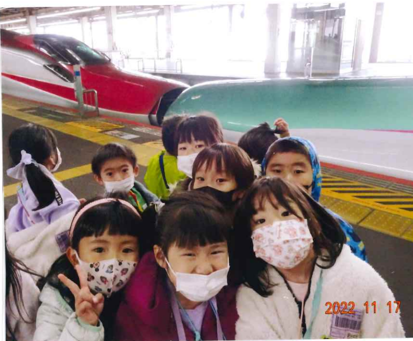
こまちとはやぶさが チューしてる〜♡