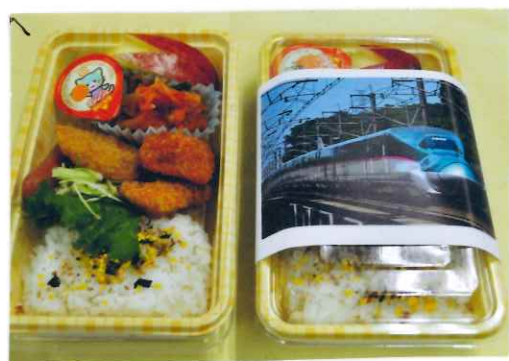
お昼はろりぽぷ特製馬弁→