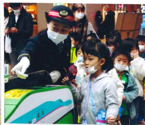
新幹線改札口では女性駅員さんがサポート