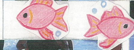
なかなかとれない金魚に 「僕のこと、女嫌いなのかな...」