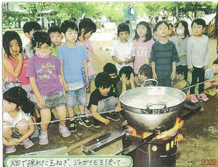
火田で採れた玉ねぎ、ジガイモを炒めて...