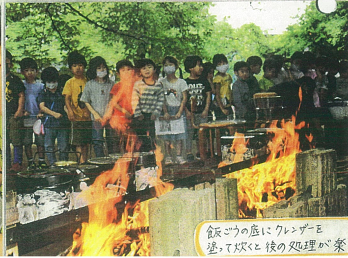
飯ごうの底にクレンザーを塗って炊くと後の処理が楽