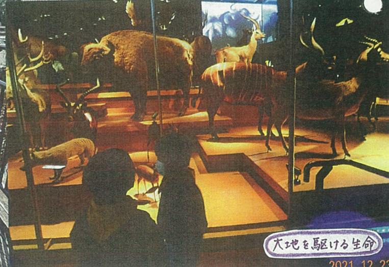
大地を駆ける生命