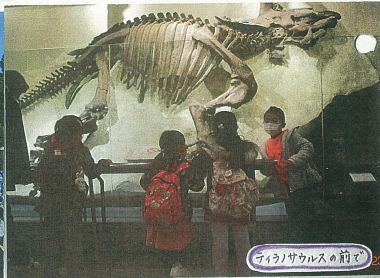
ティラノサウルスの前で