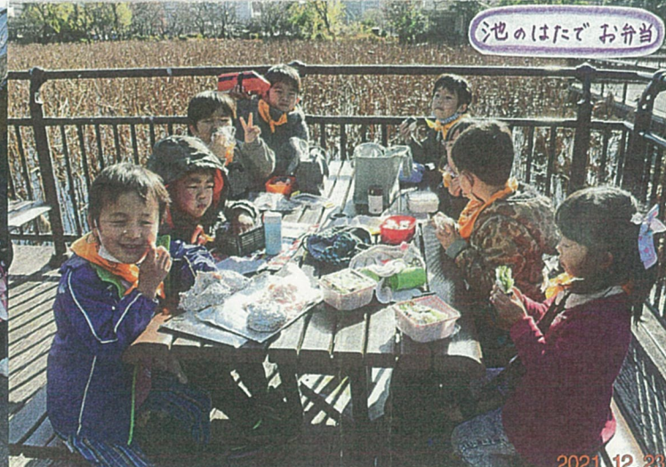
池のはたでお弁当