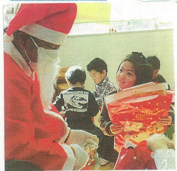
12月うまれのお友だち