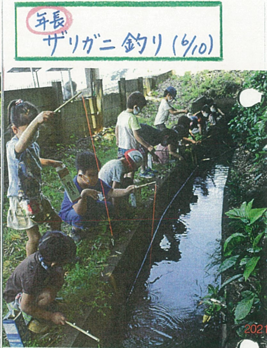
年長 ザリガニ釣り(6/10)